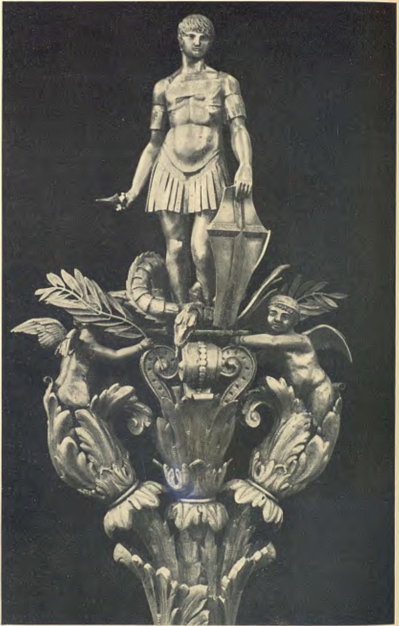
IMATGE DE SANT JORDI

CIMERA DE LA BANDERA DELS CATALANS D'AMERICA. OBRA D'ORFEBRERIA DE RAMON SUNYER